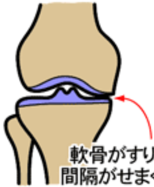
軟骨がすり減り 間隔がせまくなる

がたまること(関節水腫…かんせつすいしゅ)もありますが、関節内のヒアルロン酸は逆に減少します。