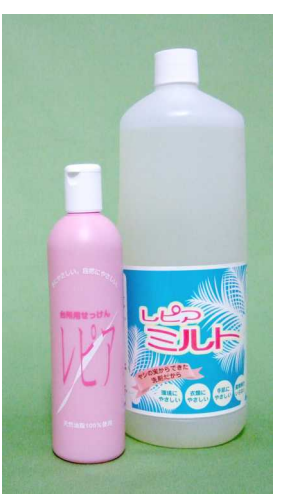
レピア台所用石けん

♪「レピア」の「やさしさ」と共通して、『レピア台所用石けん』もやさしい商品です。大きな特徴としては ・ 洗浄成分が天然油脂であるオレイン酸の石けん ・ 成分は全て天然原料 ・ 香りは、オレンジオイル であることがあげられます。石けんは地球環境にやさしいことで知られており、また石けんの中でもオレイン酸からできる石けんは、皮膚刺激がなく、お肌に安全です。 『レピア台所用石けん』は、クリーミーな泡立ちで洗浄力も高く、愛用者からも好評な商品ですが、やさしさを追求した代償として、洗っているとき食器が滑りやすいという1つだけ問題点がありました。この度、愛用者からこ